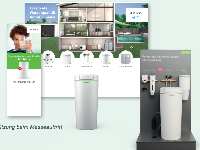
Unterstützung beim Messeauftritt