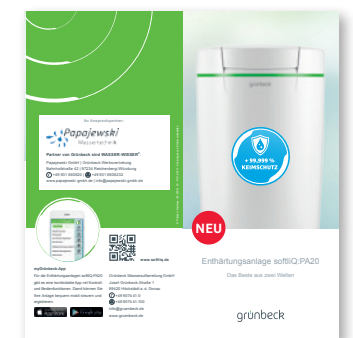
Flyer mit Logo-Eindruck