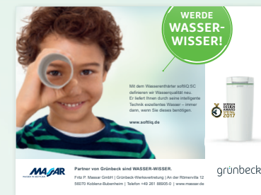
Anzeigen mit Logo-Eindruck

Als Grünbeck-Wassermeister werden Sie auf unserer Internetseite gruenbeck.de für alle Besucher als exklusiver Handwerksbetrieb aufgeführt. Der Besucher findet Sie als regionalen Ansprechpartner und hat somit die Möglichkeit, direkt und unkompliziert Kontakt aufzunehmen. Gleichzeitig erhalten Sie bei Erfüllung bestimmter Rahmenbedingungen Anfragen von Endkunden, die wir über unseren Produktfinder sowie die Produktseiten generieren. Das bedeutet, dass Sie quasi nebenbei Grünbeck-Produkte und Ihre Dienstleistung verkaufen können.