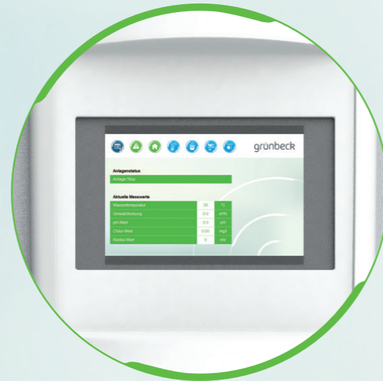
easy-to-use: Benutzerfreundliches Touchpanel mit komfortabler Steuerung